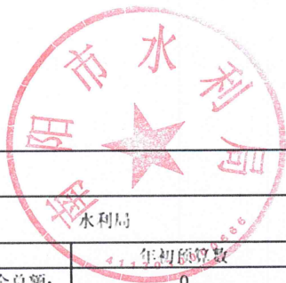
项目支出绩效自评情况表